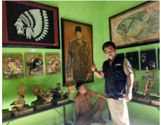
Kunjungan Ketua APDESI Kecamatan Cijeungjing