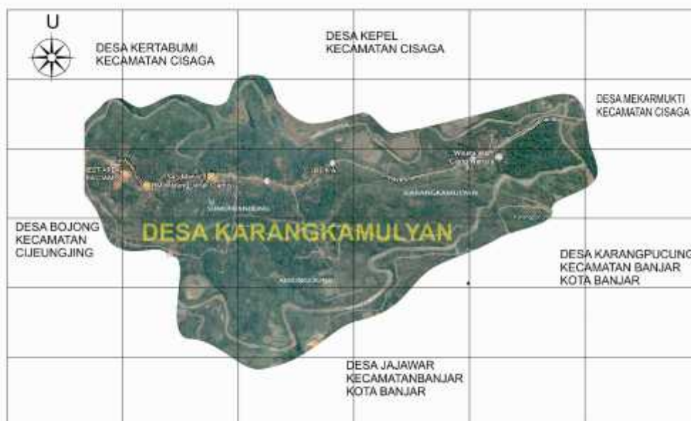
Peta Wilayah Desa Karangkamulyan Kecamatan Cijeunjing Kabupaten Ciamis