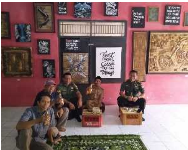
Kunjungan Danramil 1303/Bojong