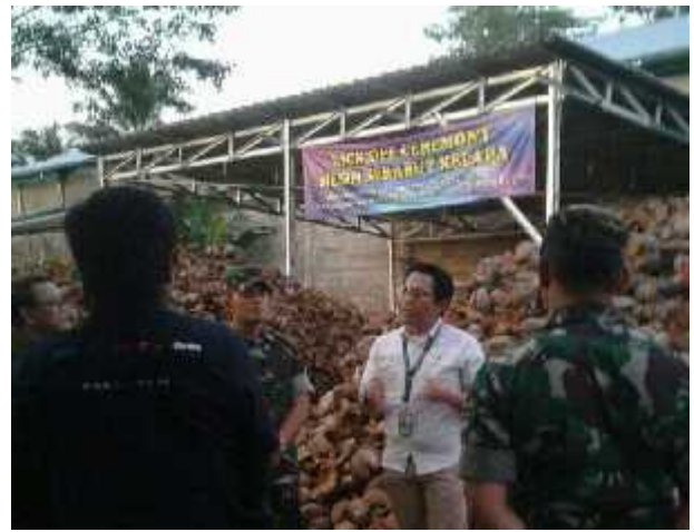
Kunjungan Direktur PT. Rekadaya