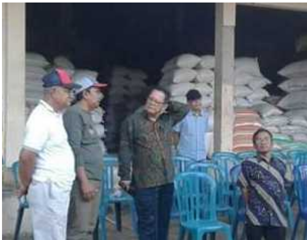
Kunjungan Deputy Restrukturisasi Usaha Kemenkop dan UKM Ri