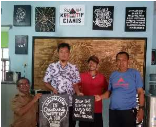
Kunjungan Kepala Sub Direktorat Kemitraan Strategis dan Wahana Inovasi Kemenristekdikti