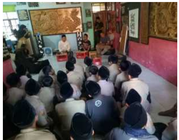
Studi Kreatif Siswa-Siswi SMA dan SMP IT Irfani