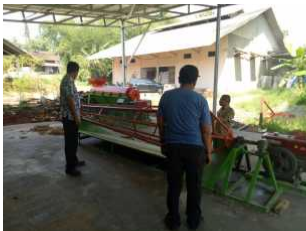
Kunjungan dari Kemenristekdikti untuk pengembangan industri serat kelapa di Gorontalo