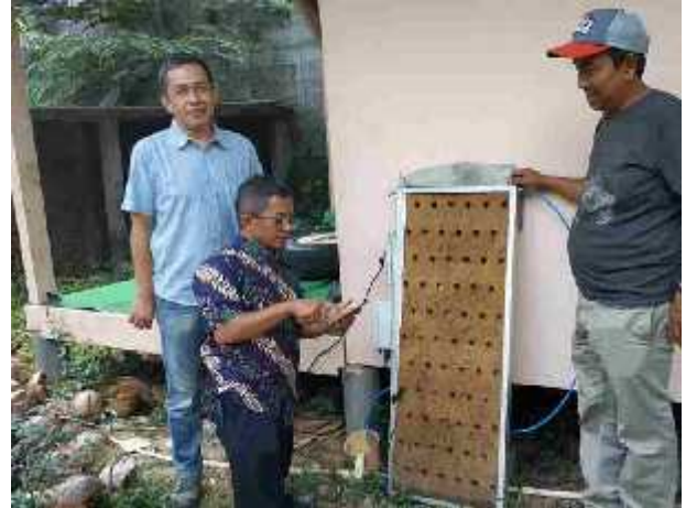
Uji coba Hasil Industri Serat kelapa untuk Media tanam IoT Vertical Garden kerjasama dengan Imahan Software